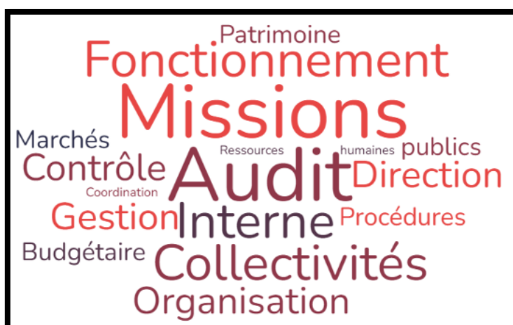
Figure 1. Nuage des mots – Axe 1