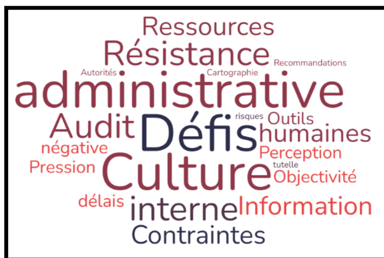
Figure 1. Nuage des mots - Axe 2

Source : Étude qualitative réalisée entre Octobre 2025 et Mars 2026 « N’VIVO 15 »