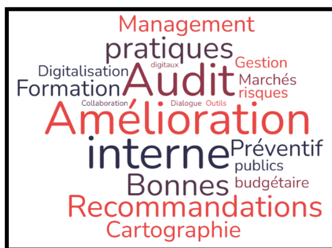
Figure 2 - Nuage des mots Axe 3